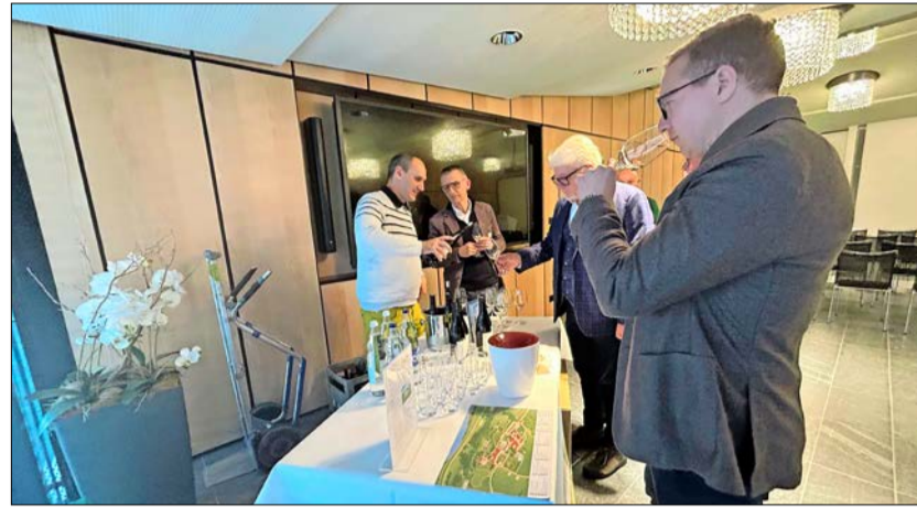
Das Stakeholder-Event der Müller-Thurgau Stiftung endete mit einer Weingustation. Auch andere Weingüter präsentierten Weine.

Die eine Gruppe der Probanden wurde aber zu Beginn der Degustation über die Umweltvorteile von Piwi-Weinen informiert. «Diese Informationen hatten aber keinen Einfluss auf die Bewertung. Der Wein muss einfach gut sein. Es nützt nichts, Piwi