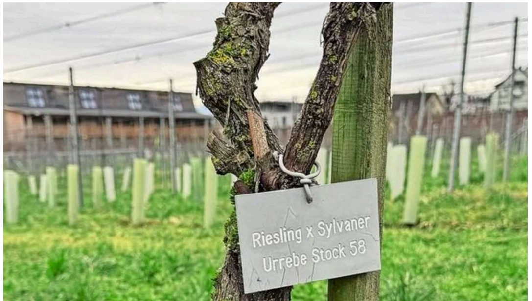
Er wächst nach wie vor an den Hängen des Zürichsees: der «Urstock 58», die erste Müller-Thurgau-Rebe.

An den Hängen der Zürcher «Silberküste» pflanzte er seine Rebe ein und verblieb bis 1924 an der Versuchsstation. Hier leistete er wertvolle Pionierarbeit im Bereich der Pflanzenzüchtung, Pflanzenforschung und auch in der Nachwuchsförderung. Zu seinen Errungenschaften zählen zum Beispiel die gezielte Zucht und Nutzung von Reihenhfen, bahnbrechende Arbeiten auf dem Fachgebiet des biologischen Säureabbaus beim Wein oder die Einführung der Sortenprüfung im Gemüseanbau.