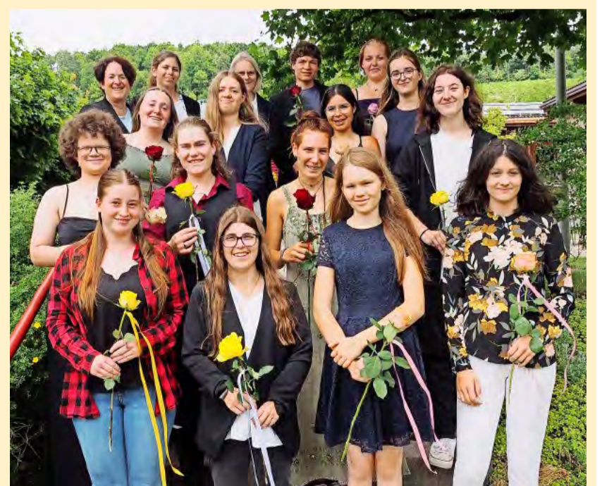
Die Pferdewartinnen und der Pferdewart EBA mit ihren Lehrpersonen (links im Bild) an der Schlussfeier am Strickhof Wülflingen.

Durchhaltevermögen, sondern auch viel Leidenschaft und Herzblut. 13 Pferdewartinnen und ein Pferdewart wurden diese Woche am Strickhof Wülflingen für ihren erfolgreichen Berufsabschluss gefeiert.