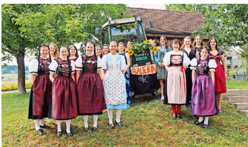
Sie haben die Fachausbildung Bäuerin in einem Semester absolviert.

zubereitet von der Küchencrew des Strickhofs Wülflingen. Den feierlichen Höhepunkt des Abends bildete die Übergabe der Urkunden und Modulpässe an die beiden Abschlussklassen, begleitet von kräftigem Applaus. Dazwischen blickten die Absolventinnen und Absolventen des berufsbegleitenden Kurses mit einer Schnitzelbank humorvoll auf ihre Weiterbildung zurück.