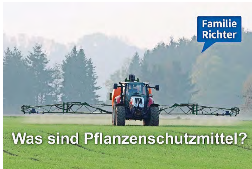
Diese Woche beschäftigt sich Familie Richter mit dem Einsatz von Pflanzenschutzmitteln.