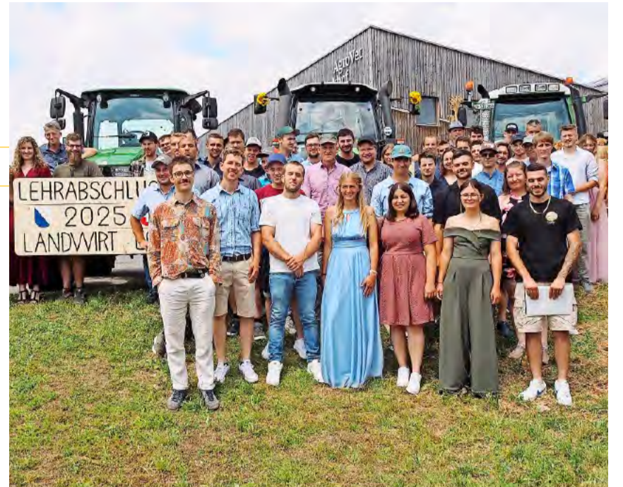
Landwirtinnen und Landwirte EFZ in Zweitausbildung.