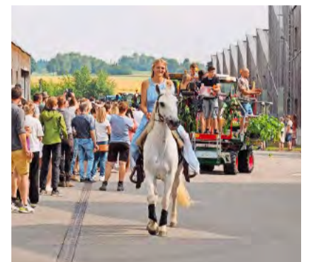
Die Traktorenparade, angeführt von einem Pferd.