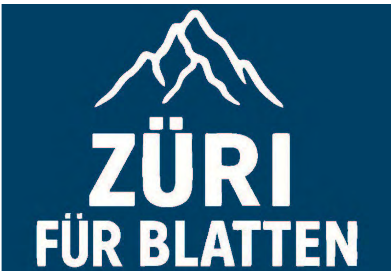
Die Aktion «Züri für Blatten» geht an diesem Wochenende zu Ende.

Zahlreiche Hilfsaktionen wurden in den vergangenen Wochen parallel gestartet, ein starkes Zeichen der Anteilnahme aus der Bevölkerung. Immer öfter war daher zu hören: «Wir haben bereits gespendet.» Trotzdem konnte die Aktion «Züri für Blatten» mit überzeugenden Argumenten viele Menschen erneut zum Spenden bewegen: Die 19 Bauernfamilien in Blatten hatten bis dato – abgesehen von Unterstützung durch die Gemeinde – noch keinerlei direkte finanzielle Hilfe erhalten. Dass das gesammelte Geld eins zu eins und unbürokratisch direkt nach Blatten