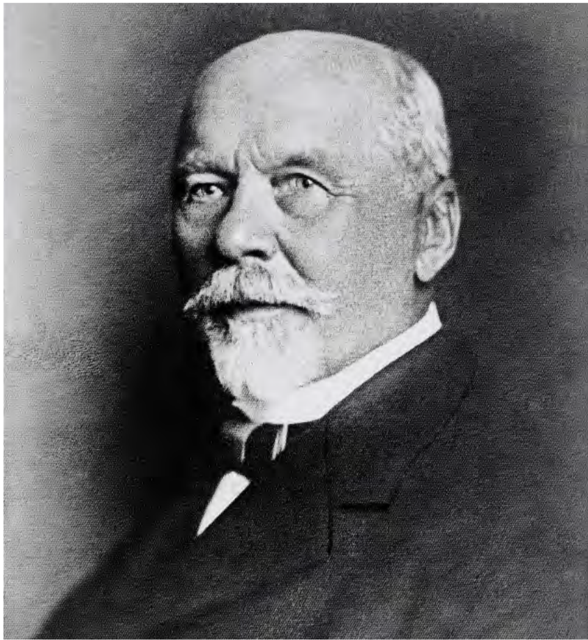
Hermann Müller-Thurgau war auch Beratungs- und Bildungspionier und hat als Schuldirektor das moderne Berufsbild der Spezialkulturen massgeblich geprägt.

Ein Beispiel: Die globale Saftindustrie verdankt ihre Entwicklung der Innovationskraft von Müller-Thurgau. Er hat die Pasteurisierung marktfähig gemacht. Die Wertschöpfung dieser Erzeugung wird auf weltweit jährlich 100–150 Mrd. Franken geschätzt. Die Nutzung von Reinzuchtheften, das Verständnis und die Nutzung des biologischen Säureabbaus, die Entdeckung der Ursachen der Alternanz bei Obstbäumen und deren Regulierung, die Entwicklung früher Formen der CA-Lagerung oder eine systematische Prüfung und Saatgutaussortierung der Sorten