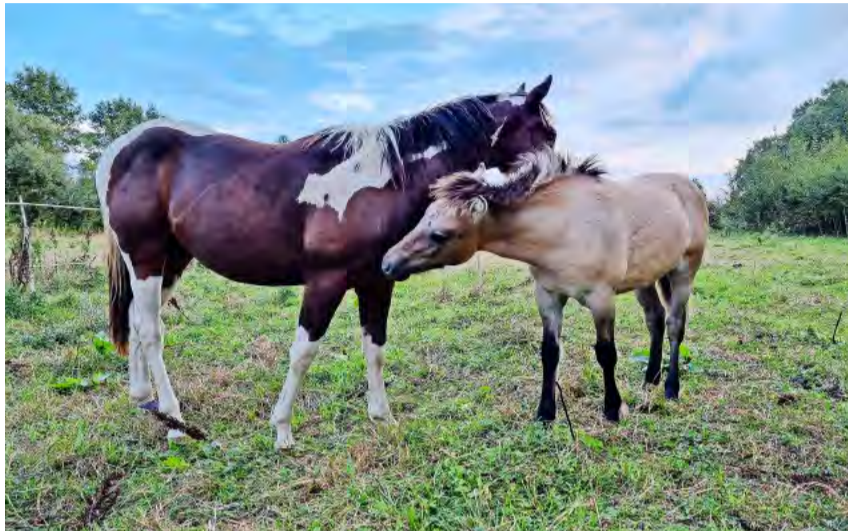
Pferde brauchen Sozialkontakt mit Artgenossen, immer und in jedem Alter..

Für langjährig bestehende Paarhaltungen von Equiden, die keine Artge-