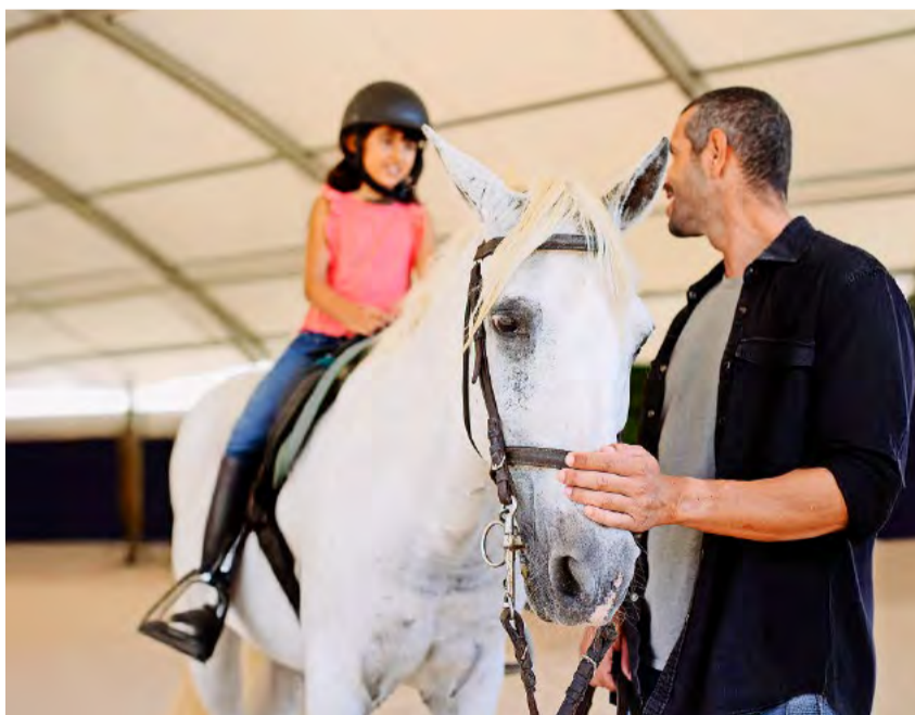
Hippotherapie gilt als Nebenbetrieb ohne sachlichen Bezug zur Landwirtschaft und muss bewilligt werden.

Zudem dürfen die Nebenbetriebe nur vom Bewirtschafter oder von der Bewirtschafterin des landwirtschaftlichen Gewerbes beziehungsweise von der Lebenspartnerin oder dem Lebenspartner geführt werden. In jedem Fall muss die in diesem Betriebssteil anfallende