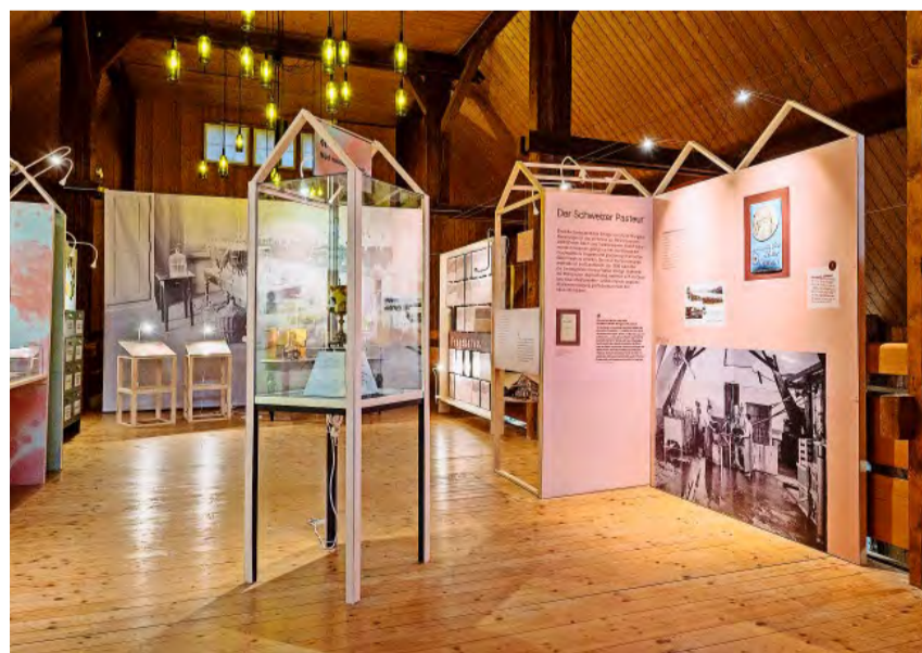
Die Sonderausstellung zum Geburtstag von Hermann Müller-Thurgau läuft noch bis am 26. Oktober 2025.

Die Ausstellung spannt einen Bogen von seinen frühen botanischen Studien, über die weltbekannte Kreuzung aus Riesling und Madeleine Royale, die später als Sorte «Riesling-Silvaner» oder «Müller-Thurgau» bekannt wurde, bis