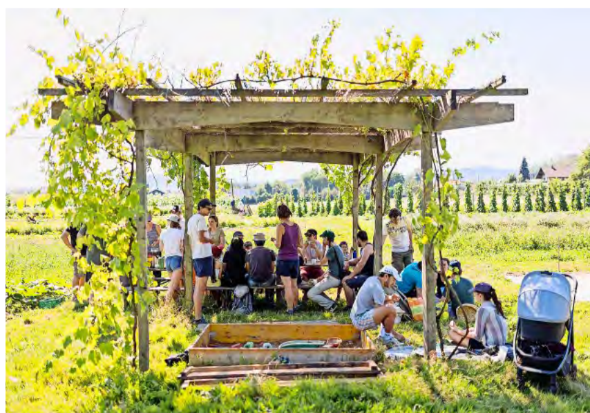
Die Pausen bei den Arbeitseinsätzen fördern das Gemeinschaftsgefühl.

Genossenschaft ortoloco info@ortoloco.ch www.ortoloco.ch