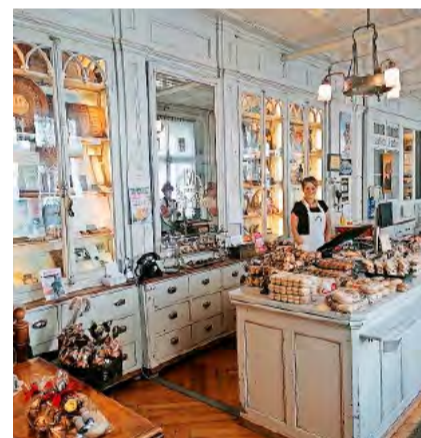
Die Lebkuchen-Bäckerei «Zum Goldenen Apfel» ist im ältesten Gebäude der Umgebung zu finden.

Mit einem Lebkuchen-Gebäck in der Tasche liefen wir zur nächsten Station, dem Laden beim Kloster Einsiedeln.