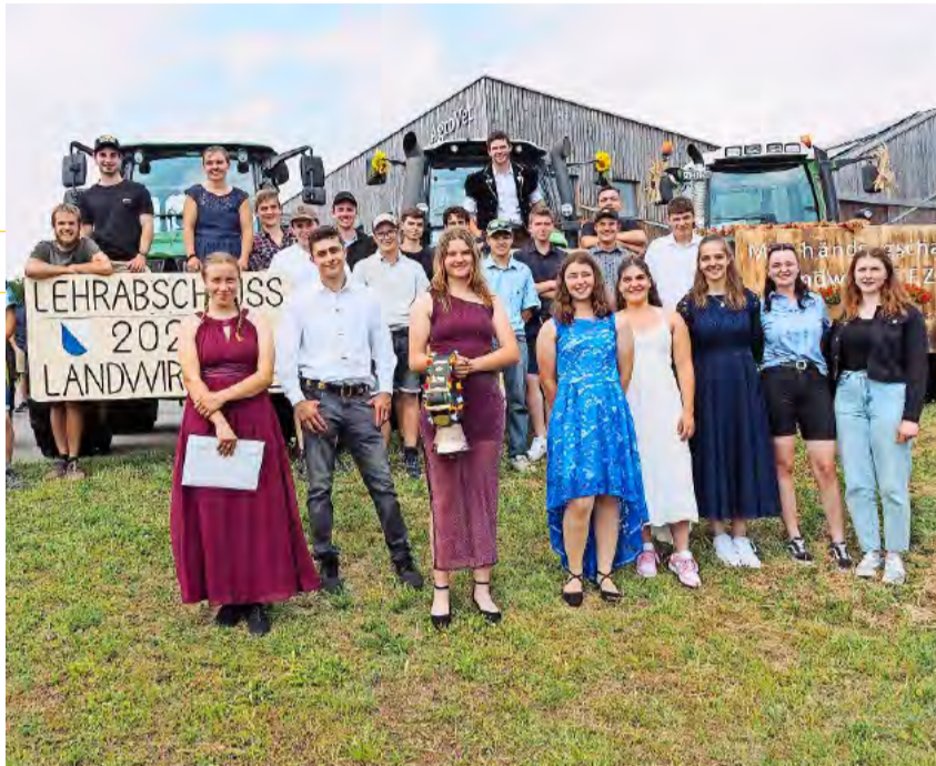
Landwirtinnen und Landwirte EFZ in Erstausbildung.