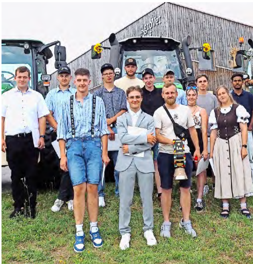
Agrarpraktiker EBA mit den Fachrichtungen Spezialkulturen und Landwirtschaft.