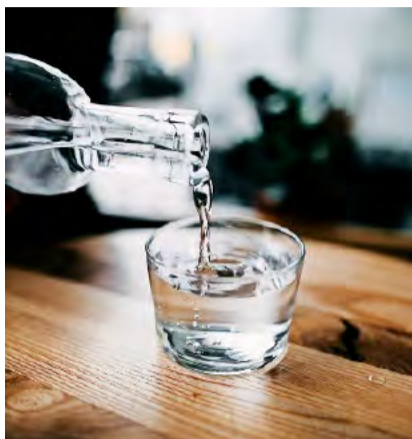
An Hitzetagen ist regelmässiges und ausreichendes Trinken unumgänglich.

Wenn die Temperaturen während mehrerer Tage über 30°C liegen und nachts nicht unter 20°C sinken, spricht man von einer Hitzewelle. Diese klimatische Situation kann ein Gesundheitsrisiko darstellen und die körperliche und geistige Leistungsfähigkeit beeinträchtigen. Vor allem ältere Menschen, (chronisch) kranke Personen, Schwangere und Kleinkinder sind gefährdet. Aber auch Bäuerinnen und Bauern, die draussen arbeiten, müssen an heissen Tagen besonders gut auf genügend Flüssigkeitszufuhr achten. Empfohlen wird regelmässiges Trinken von Wasser in kleineren Mengen (2,5 dl), um den Körper ausreichend mit Wasser zu versorgen und Erschöpfungszuständen vorzubeugen. Auch Pausen im Schatten und leichte Mahlzeiten helfen dabei, dass sich der Körper wieder regeneriert. Leichte, helle und weite