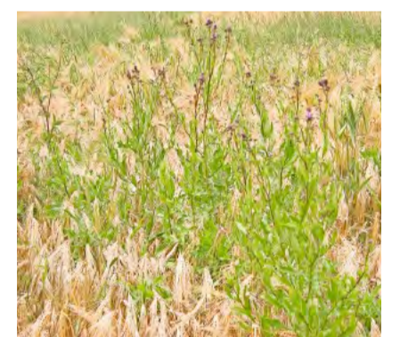
Das Verhindern der Versamung der Disteln ist ein Akt der guten Nachbarschaft.

Dieser Frassschaden per se kann zwar vernachlässigt werden, nicht jedoch die damit verbundenen sekundären Pilzinfektionen, welche Fäulnis verursachen. In der östlichen Schweiz ist heuer noch kaum mit Schäden zu rechnen.