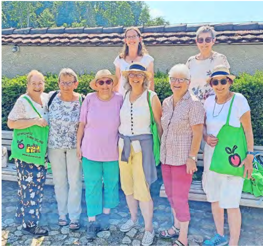
Acht Winterthurer Landfrauen genossen einen ereichnisreichen Tag in Einsiedeln.

Wir teilten uns in zwei Gruppen auf und marschierten los. Anhand von Bildern auf den Instruktionsblättern mussten wir durch die Strassen laufen und die Gebäude suchen. Bei einem Rundbau, auf welchem gross «Panorama» stand, konnten wir einen Zwischenstopp machen. Wir wurden herzlich eingeladen, reinzugehen und uns die Ausstellung anzusehen. Der Eintritt zum hal-