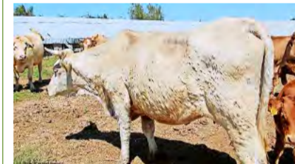
Ein an der Lumpy-Skin-Krankheit erkranktes Rind.

VETA. Am 29. Juni 2025 wurde in Frankreich erstmals die Lumpy-Skin-Disease bei Rindern festgestellt. Die Krankheit ist hoch ansteckend, betrifft aber nur Rinder, Büffel und Bisons – Menschen und andere Tiere sind nicht gefährdet. In der Schweiz gibt es bisher keinen Fall. Übertragen wird das Virus durch Stechinsekten wie Fliegen oder Mücken. Erste Anzeichen sind Fieber, Nasen- und Speichelfluss, Abmagerung und Leistungsabfall. Typisch sind harte, schmerzhafte Hautknoten am ganzen Körper. Bei Verdacht bitte sofort die Bestandstierärztin oder den Bestandstierarzt kontaktieren. Das BLV informiert laufend über betroffene Gebiete und Massnahmen. Siehe QR-Code.