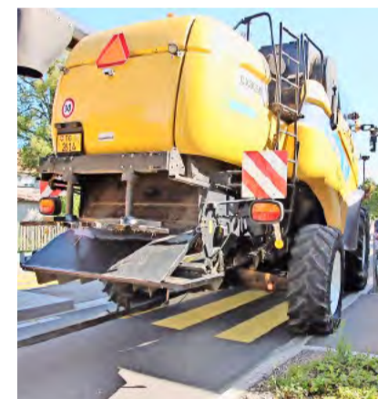
Hier wurden die Strassendimensionen zu knapp berechnet.

Damit solche Probleme gar nicht entstehen, ist es entscheidend, dass Landwirte frühzeitig Einblick in Baupläne ihrer Gemeinden nehmen – am besten, noch bevor diese Projektplanungen finalisiert sind. Werden die nötigen Dimensionen nicht eingehalten, sollte unbedingt Einsprache erhoben werden. Unterstützung bietet die Kommission Landtechnik des Zürcher Bauernverbands. Kontakt: landtechnik@zbv.ch oder Tel. 044 217 77 33.