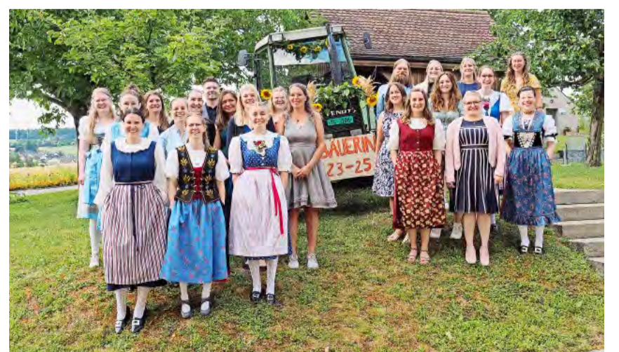
Sie haben die Fachausbildung Bäuerin/Bäuerlicher Haushaltleiter berufsbegleitend absolviert.