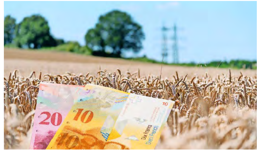
Die Bauern haben bei gleichem Einkommen seit Einführung der sogenannten «Weiterentwicklung der Direktzahlungen» in der AP 2014–2017 nur mehr Arbeit.

Anstatt diese ungelöste Ursache der Unterbezahlung der Landwirtschaft im Hochlohnland zu beheben, belehrt die Gesellschaft von «grün» bis «neoliberal», die Landwirtschaft koste zu viel und belaste erst noch das Klima und somit die Lebensgrundlage der Allgemeinheit. Die berechtigten Bauernproteste werden als «rasende Bauern» ab-