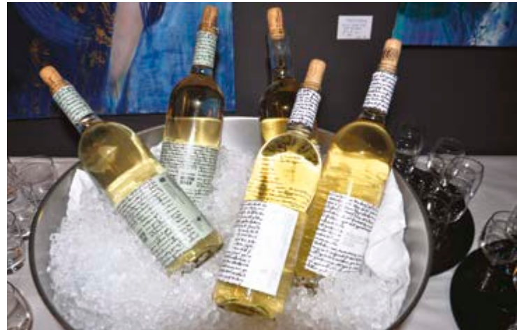
Schön gekühlt sind die beiden Müller-Thurgau für den Apéro bereit.

einem schönen Blassrosa gekelterte Pinot Gris gefiel dank seiner vollen Aromatik nach reifen gelben Früchten.