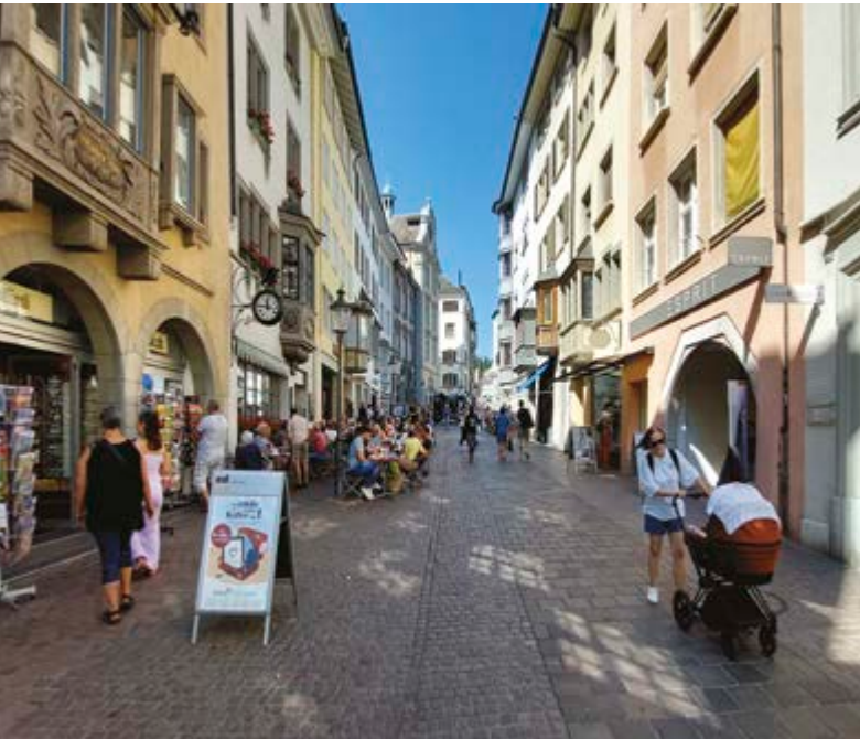
Il centro storico di Sciaffusa ha molto charme da offrire.