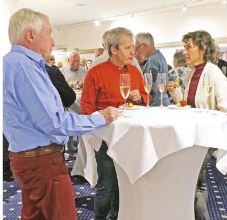
Zum Apéro: Brut Trento DOC 51,151. Der Name feiert den Stundenrekord, den Francesco Moser im Jahr 1984 in Mexiko-Stadt aufstellte.

Die erste Vorspeise ist ein klassisches Südtiroler Gericht: Ricotta-Knödel auf Lauchbett wird begleitet von drei Weissweinen aus dem Kloster Neustift. Seit 1142 im Weinbau tätig ist die Stiftskellerei Neustift eine der ältesten aktiven Weinkellereien der Welt. Die Trauben wachsen in den stiftseigenen Weinbergen im Bozner Talkessel. Im Keller wird versucht den terroir-geprägten Charakter der Sorte zu erhalten um möglichst typische und charaktervolle Weine zu erzeugen. Ein Pinot Grigio Classico macht den Anfang, daneben wird ein Kerner Classico eingeschenkt und als dritter ein Gewürztraminer Praepositus. Alle drei Weine sind sortenrein.