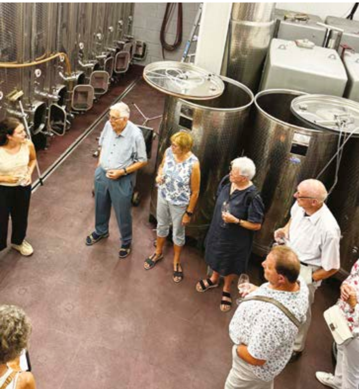
Beim Rundgang durch die Kellerei mit einem Glas Wein in der Hand.

Sandsteinamphore ausgebaut und gefällt mit der fruchtig-mineralischen Mischung.