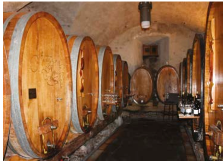
Construite dans les vieux remparts du bourg, la cave et ses foudres.

L'automne et ces belles couleurs incitent les amies et amis du vin du Haut-Lac à sortir pour la traditionnelle brisolée, ce plat typique qui allie châtaignes, fromages et salaisons.