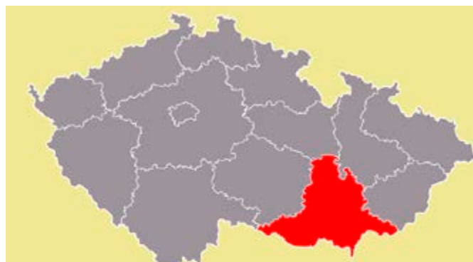
Tschechien mit der 7'200 Quadratkilometer grossen Region Südmähren.