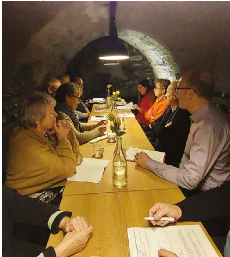
L'incontro dei presidenti dell'ANAV nella profonda cantina a volta.