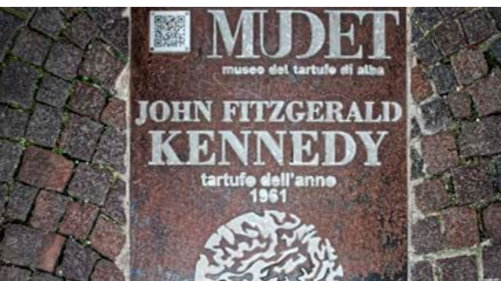
La plaque commémorative dans une rue devant le Musée de la truffe.

ce week-end qu'a lieu la vente de ce tubercule tant convoité. La foire existe depuis 1929. Chaque année, la foire offre une truffe en signe d'estime et reconnaissance à une personnalité. Le président John F. Kennedy était 'Tartufo del anno 1961' et dans une des rues de la ville, une plaque commémorative nous le rappelle.