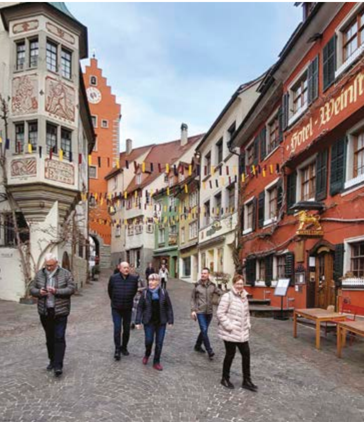
Halt in Meersburg, in der Nebensaison Samstags fast menschenleer.

Fast nebenbei wurde auch ein langjähriger Irrtum des Schreiblings zu den «Schmuggelfahrten über den Bodensee» geklärt. Tatsächlich begann vor genau 100 Jahren mit einer spektakulären Schmuggelfahrt mit dem Ruderboot über den Bodensee, die Erfolgsgeschichte der Müller-Thurgau-Rebe auch am badischen Bodenseeufer. Bei der Weinprobe wusste bei Weitem nicht nur der Müller-Thurgau zu überzeugen.