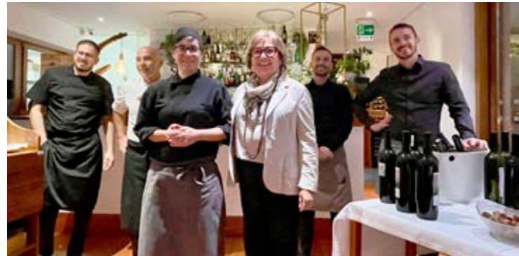
Lo staff del ristorante L'Approdo che ci ha servito con competenza.